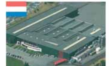
PROCAP Wiltz SA Zone industrielle de Wiltz - BP 49 L-9501 Wiltz - LUXEMBOURG Tél +352 95 94 94 1 Fax +352 95 94 95