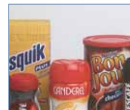
Produtos instantâneos em pó, leite em pó, edulcorantes, cacau