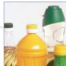
Azeites e óleos alimentares, vinagres