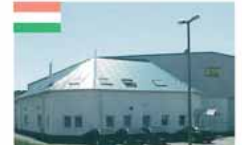
PROCAP Duna Rt 51-es út 26,5 km H-2336 Dunavarsány - HONGRIE Tél +36 245 21 020 Fax +36 245 21 029