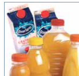
Sumos de fruta, néctares