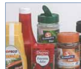
Especiarias, condimentos, molhos