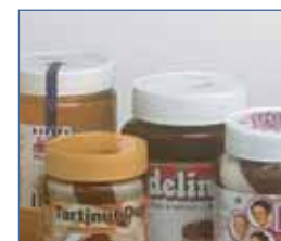
Cremes de barrar