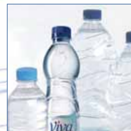
Águas, bebidas gaseificadas